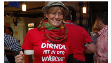
(Fast) ohne Dirndl.